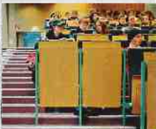
RAUM FÜR NEUES Hörsaal an der Uni Lüneburg

Die Leuphana Universität Lüneburg wird zum Wintersemester 2007/08 ein neues Studienmodell einführen.