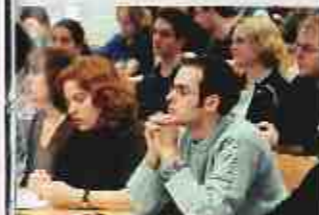
WEITBLICK Studenten der Uni Greifswald erlernen die Rechtsordnungen Nordosteuropas

Spitzenwerte ●●●● 84 bis 66 Punkte Mittelwerte ●● 65 bis 28 Punkte Schlussworte ● 27 bis 0 Punkte ●●●● 70 bis 50 Punkte ●●● 49 bis 26 Punkte ● 25 bis 0 Punkte ▲ verbessert ▼ verschlechtert ▶ gleich geblieben B = Bachelor D = Diplom L = Lehre F = Forschung