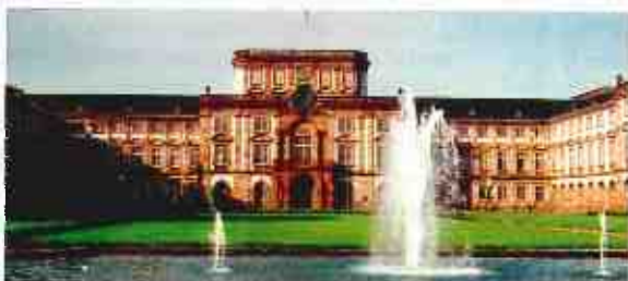
SPITZENLEHRE Die Uni Mannheim genießt seit Jahren einen exzellenten Ruf und arbeitet weiter an ihrem Profil