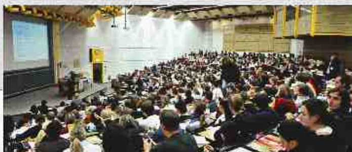
DOPPELT PUNKTEN VWL-Studenten der Universität Augsburg erhalten ihr Diplom mit integriertem Bachelor Abschluss

Spitzenwerte ●●● 67 bis 56 Punkte ■■■ 54 bis 53 Punkte ▲ verbessert B = Bachelor L = Lehre Mittelwerte ●● 55 bis 31 Punkte ■■ 52 bis 30 Punkte ▼ verschlechtert D = Diplom F = Forschung Schlusswerte ● 30 bis 0 Punkte ■ 29 bis 0 Punkte ► gleich geblieben