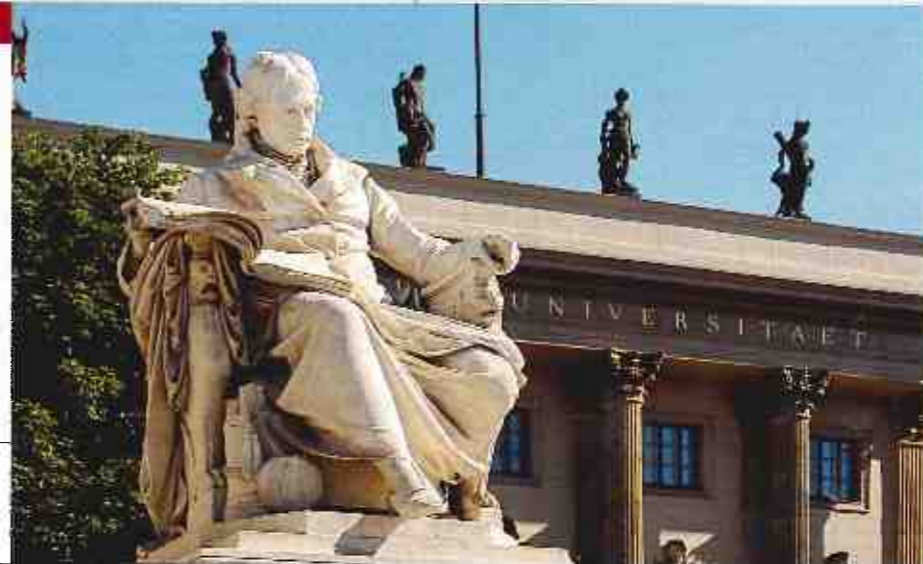
TRADITION In die Spitzengruppe aufgerückt ist die Berliner Humboldt-Universität, die 1810 von dem liberalen Bildungsreformer Wilhelm von Humboldt gegründet wurde

Das FOCUS-Ranking basiert in Teilen auf Sonderauswertungen der amtlichen Hochschulstatistik des Statistischen Bundesamts in Wiesbaden. Diese repräsentiert die von den Universitäten an die Landesämter übermittelten Daten. Nicht gemeldete oder unzureichend berichtete Angaben können die Ergebnisse gegebenenfalls beeinflussen.